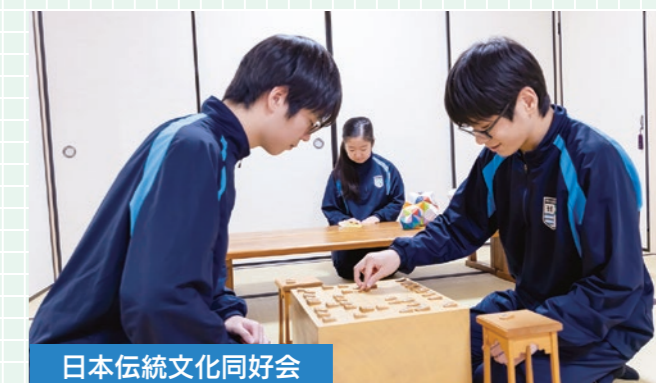
日本伝統文化同好会

文芸部では、イラスト集「zero」の製作を中心に、明るく楽しく創作活動を行っています。学年、性別は関係なく、誰でも大歓迎です！