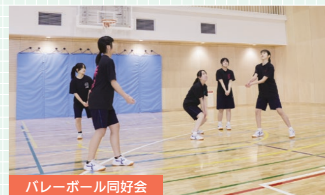
バレーボール同好会

校庭で活動を行っています。サッカーを通じて皆で明るく楽しく練習し、協力し合いチームワークを育んでいます。サッカー初心者でも大歓迎です！