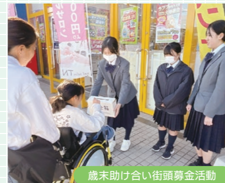
歳末助け合い街頭募金活動